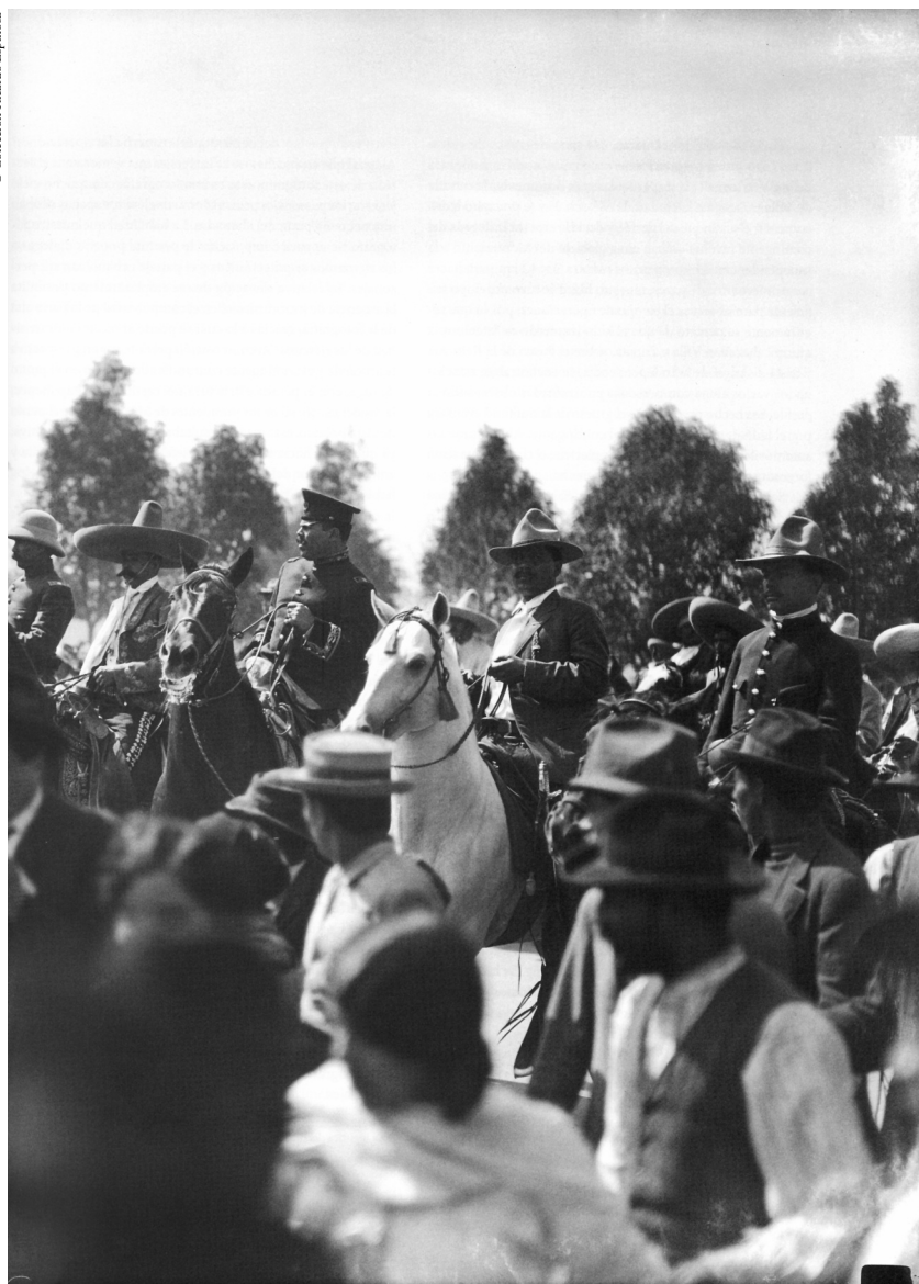
Llegada de Francisco Villa y Emiliano Zapata a México, 6 de diciembre de 1914

Sí, Los Tres Mosqueteros era ya un clásico popular en las lecturas mexicanas. ¿Pero qué atraía en esos días a cada uno de aquellos lectores en las personas de Athos, Porthos, Aramis, y el cuarto del terceto, D'Artagnan? Porque me resulta que era un tema de referencia y de mutuo entendimiento: cada uno de los diversos lectores sabía a qué rasgo de presencia o de carácter aludía el otro cuando se refería a uno de los cuatro mosqueteros. Era un terreno de reconocimiento y de conexión: explorar esos terrenos nos dice de quienes en ellos se conocen y se conectan. Y en eso consiste explorar, descubrir o intuir los inesperados lazos que en su curso anuda una re-