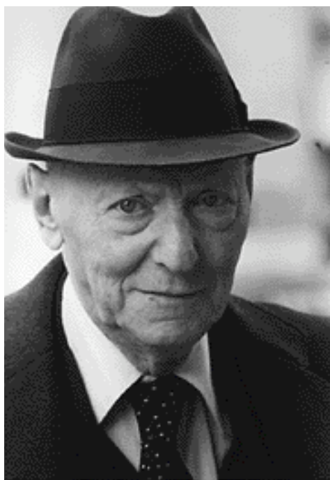
Isaac Bashevis Singer

Zamir le habla de ella a su padre. Bashevis le pregunta: