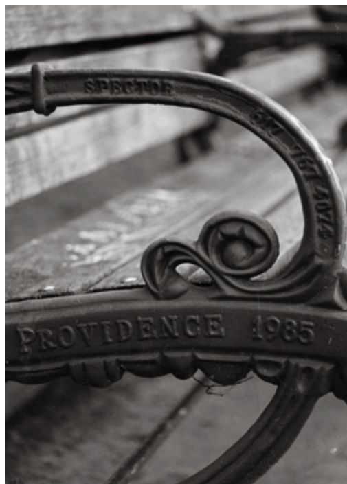
"Lovecraft en Providence halló, vivió y agotó el paraíso en la tierra."

En el restaurante L'Epicurio del Hotel Providence todo es lujoso pero falso. Prefiero salir a recorrer la ciudad de noche para recordar solidariamente a Lovecraft que, como los niños, comía helados y odiaba los maravillosos mariscos que sólo se dan en sus mares fríos. De vuelta a mi cuarto de hotel, mientras consumo mis magras raciones, condimentadas por el hambre y la fatiga, miro a través de la ventana: los solitarios de Grace Church se disponen a resistir la noche. A lo largo de ella, en los cuartos vecinos hay lamentos y ruidos extraños. Es la imaginación exaltada por Lovecraft, me digo. Más tarde, mi amigo Gilberto Prado Galán me dirá que en su visita a Providence se enterará de que en la ciudad está prohibida la prostitución, pero que los hoteles de todas las categorías