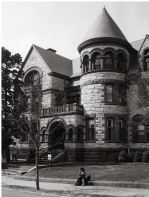
"Providence, ciudad de colinas y estudiantes..."