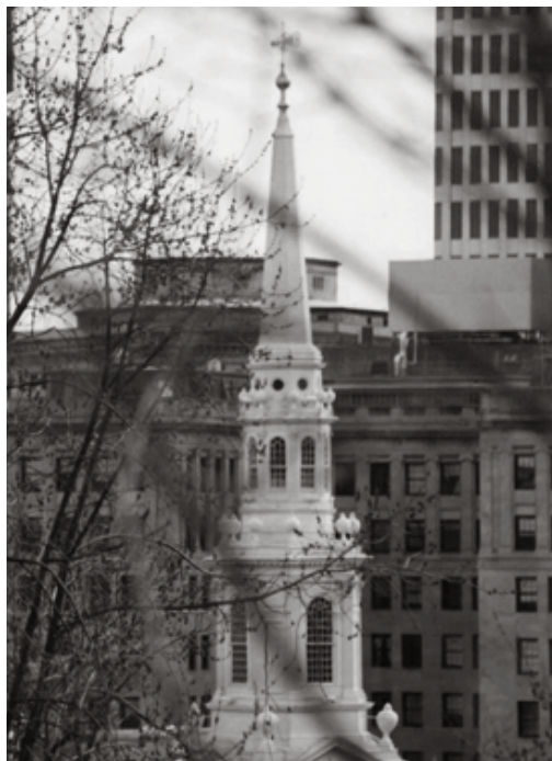
“Providence devolvió a Howard con creces sus caminatas y retornos, su anclaje en calles y edificios...”

Para despedirse mejor de la ciudad de Lovecraft es conveniente hacerlo en una librería de segunda mano. Cellar Stories se ostenta como el más grande negocio de libros raros y usados de Rhode Island. No hay aparador. Para llegar a ella hay que subir unos escalones desvencijados que conducen a un segundo piso donde se exhibe, en ordenado caos, un arsenal bibliográfico que va de lo desechable a lo maravilloso. No tienen por desgracia —y también por fortuna— la primera