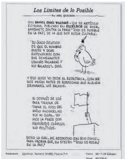
Abel Quezada, “Los límites de lo posible”, Excelsior , núm. 18880, 9 de noviembre de 1968, p. 7-A.