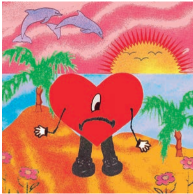
Portada del álbum Un verano sin ti , 2022.

A ejemplo de Berlioz, cuya Sinfonía fantástica nació de una decepción amorosa, Bad Bunny también escribe canciones en clave, a manera de bálsamo. Endecha rupturas y dirige mensajes de reivindicación a las mujeres que ciegamente lo atrajeron a su llama, cual mariposa incauta, sin saber que se las tenían con el ave fénix.