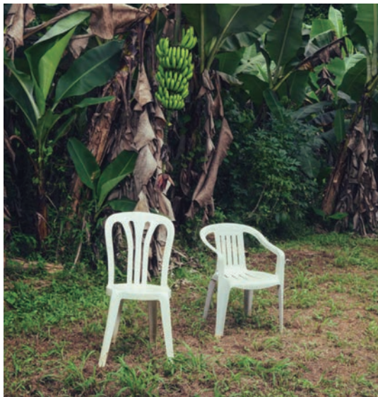
Portada del álbum Debí tirar más fotos , 2025.