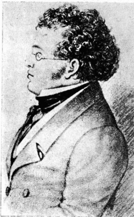
Schubert — "música de comunión"

descubre en la imagen de devoción parecen ser las mismas que percibimos en una sinfonía de Mozart, pongamos por caso. La fuga de Bach es típica de esa especie de música que escuchamos sin mezclarnos en ella y sin que ella se mezcle en nosotros, que tiene su ámbito propio en nuestra exterioridad, que está ahí para que la contemplemos y revelemos. La sinfonía de Mozart, al contrario, representa la música que puede ser nuestra, y de hecho lo es, como alma de nuestra alma, música cuyo ámbito propio es nuestra interioridad, lugar donde parece completarse definitivamente. Así, pues, no creo muy aventurado establecer la distinción entre la música que podríamos denominar de