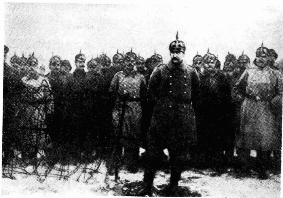
"guía al alma del Kaiser"

Es el sentido de la eficacia lo que lleva a Ince a anticiparse en muchos casos a un Dreyer o a un Eisenstein en el logro de efectos formales que después habrán de identificarse con la idea del clasicismo cinematográfico. Ince consigue crear en nosotros la sensación de que cada uno de sus planes, cada una de sus escenas, sólo puede resolverse de una manera: la que él propone. Esa endemoniada habilidad debe casi todo al hábito de pensar que el cine no sirve para ilustrar ideas ya conocidas de antemano por la generalidad, sino que el cine es, por encima de todo, creador de ideas. De ahí que Ince parezca estar convencido de que él es el primero en denunciar los horrores de la guerra y el