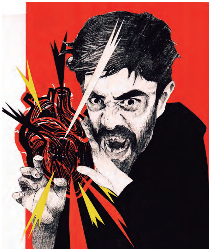
El corazón del coronel Bufanda, 2025.

la bipolaridad o admitieron desde la primera consulta estar deprimidos, cuando menos.