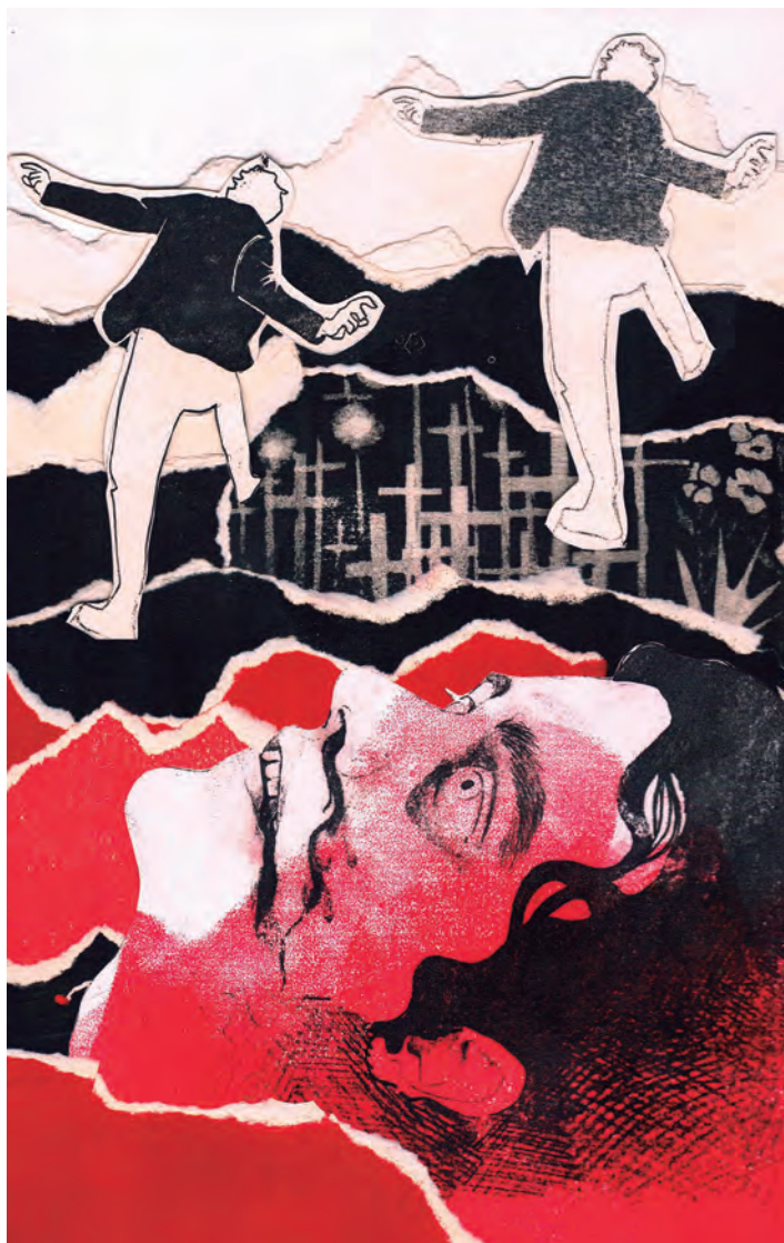
Zafiro y Zequiél, 2025.

Cómo encontrar el salvavidas que nos rescate de este tiempo. Pero también: cómo ser capaces de escribir el miedo de manera frontal, brutal, sin que se vuelva un analgésico. JM