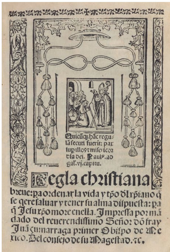
Juan de Zumárraga, Regla cristiana breve, 1547.

existen? ¿Cómo llegaron a México? ¿En qué lugares se emplearon antes y para editar qué clase de obras?