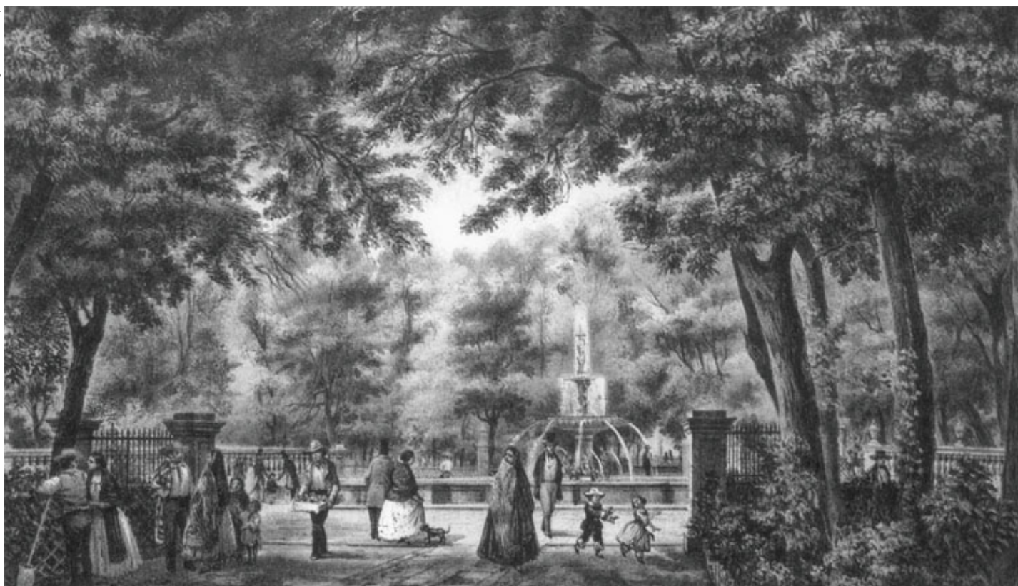
La Alameda de México, 1858