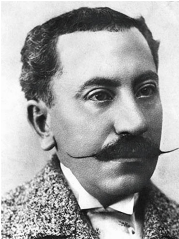
Manuel Gutiérrez Nájera