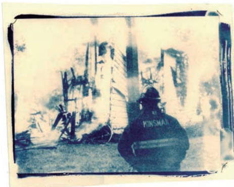
Kinsman (House Fire While Driving Across the Country) [cianotipo], 2019.

La espera y los obstáculos valieron la pena. Siempre hemos vivido en el castillo no sólo es el mejor libro de Shirley, también es uno de los más importantes de la literatura norteamericana. El entusiasmo de la crítica fue unánime. Como solía pasar con cada libro que publicaba, los reseñistas no se ponían de acuerdo sobre el género al que pertenecía. Los análisis se debatían entre situar el libro entre el terror, el policíaco y el tono “shocker”, como el utilizado en “La lotería”. Beatrice Washburn, del Miami Herald , comentó que Shirley no necesitaba “fantasmas, hombres lobo o cadenas chirriantes para provocar terror”. Le bastó con crear dos personajes tan memorables como inquietantes: las hermanas Blackwood —Mary Katherine “Merricat” y Constance—, encerradas en su casa tras la muerte misteriosa de toda su familia por envenenamiento. El pueblo entero las odia y lo hará hasta el perturbador