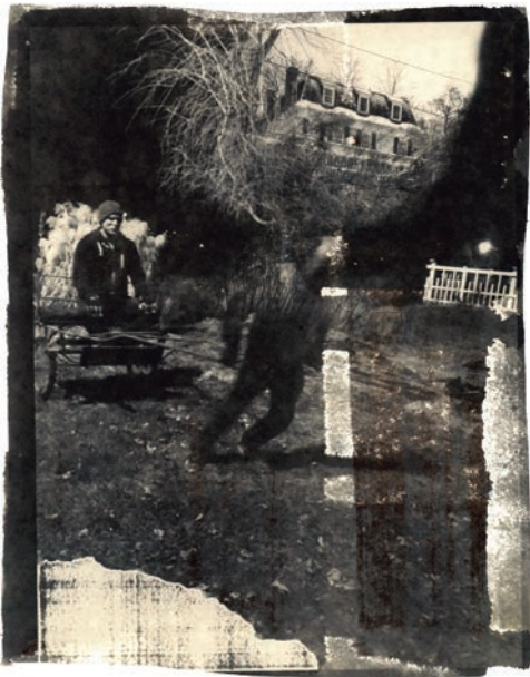
Krampus (Christmas at the Inn) [calotipo], 2019.

Algunos estudiosos coinciden en señalar que el carácter ominoso de la mansión de Hill House constituye un reflejo del matrimonio de Shirley, para entonces cruzado por diversas sombras. Su esposo, un resentido escritor menor —cuyo nombre no tiene caso mencionar—, era un hombre infiel y distante, más interesado en sus alumnas del Bennington College que en su familia. Shirley se debatía entre su papel de escritora afamada y el de esposa devota que debía hacerse cargo del hogar. Con los años, sus ansiedades y sobrepeso aumentaron, llevándola a una espiral de alcohol y pastillas a las que era adicta —Valium, Seconal, Thorazine, Dexamyl, entre otras—. Eventualmente desarrolló agorafobia, padecimiento que en sus últimos años la mantuvo encerrada en su hogar.