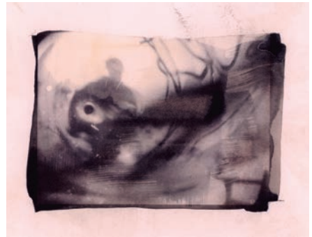
My father as a ghost [calotipo], 2019.

largo de un año. Hablaban de hijos, maridos y escritura. Esta inusual amistad revela la naturaleza modesta de Shirley, capaz de relacionarse con alguien que no era famosa como ella; también muestra, de manera conmovedora, la profunda soledad a la que estaba sometida. Nunca se conocieron en persona, pero Jeanne jugó un papel esencial en ese momento en la vida de Shirley, que estaba atascada en la escritura de Siempre hemos vivido en el castillo y que encontró en su amiga un consuelo durante esos días de bloqueo creativo.