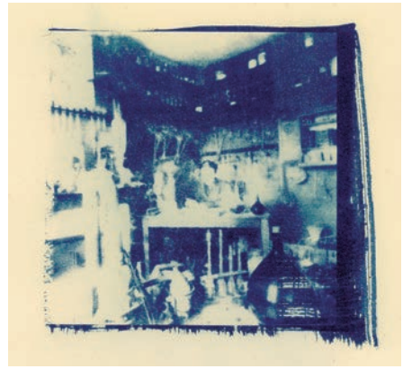
Fulcanelli in his laboratory in Paris [impresión de sal], 2019.

Antes de que las cosas empeoraran radicalmente, buscó dos formas de evadir su sofocante vida familiar. Una de ellas era su participación en la Suffield Writer-Reader Conference, en Connecticut,