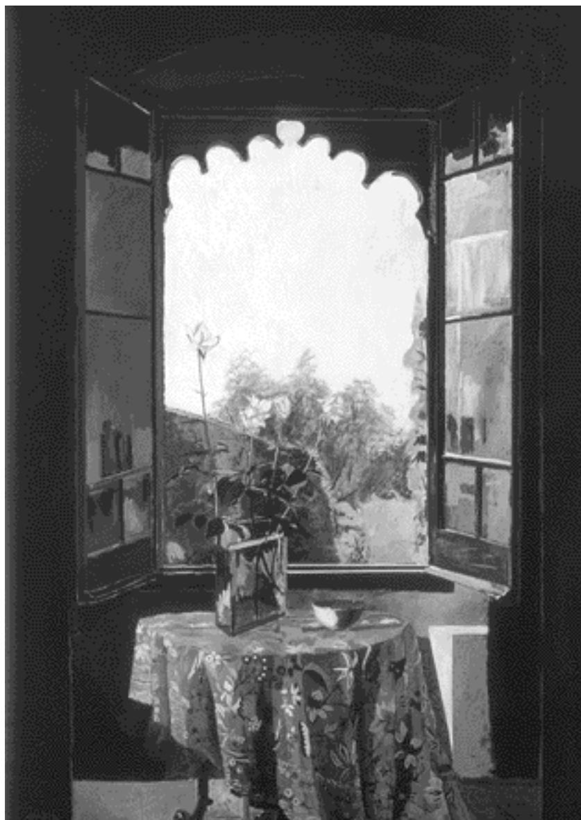
Vicente Gandía, Ventana con rosas , 1989

Yo devoraba con los ojos todo aquello que no podría devorar con la boca. Y antes de marcharme, pasaba revista a las vitrinas de la dulcería Larín. Aquí un estante lleno de mazapanes de almendra; junto a él, cien pomos con todas las figuras del mundo, hechas caramelo; después, el enorme burro de chocolate, y a sus pies, docenas de muñecas de azúcar. Más allá, cajas y cajas de galletas finísimas; botes de vidrio repletos de dátiles, pasas y cerezas, y un tumulto de paletas en forma de animales; y miles y miles de dulces envueltos como flores... 22