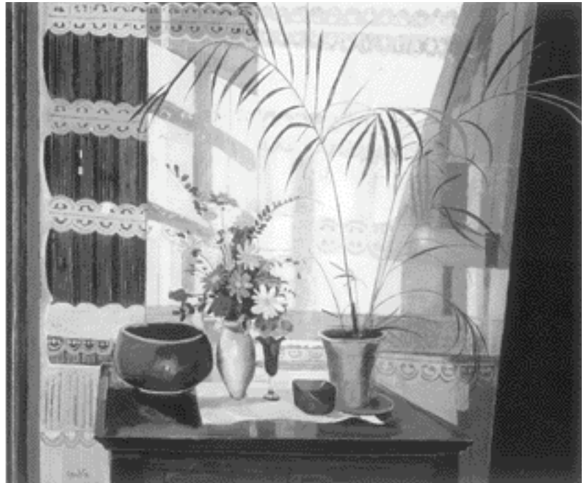
Vicente Gandía, Interior con palmas y cortina , 1980

pliéndole sus caprichos. Se sentía culpable al haberla lanzado hacia la vida que ella tanto deseaba.