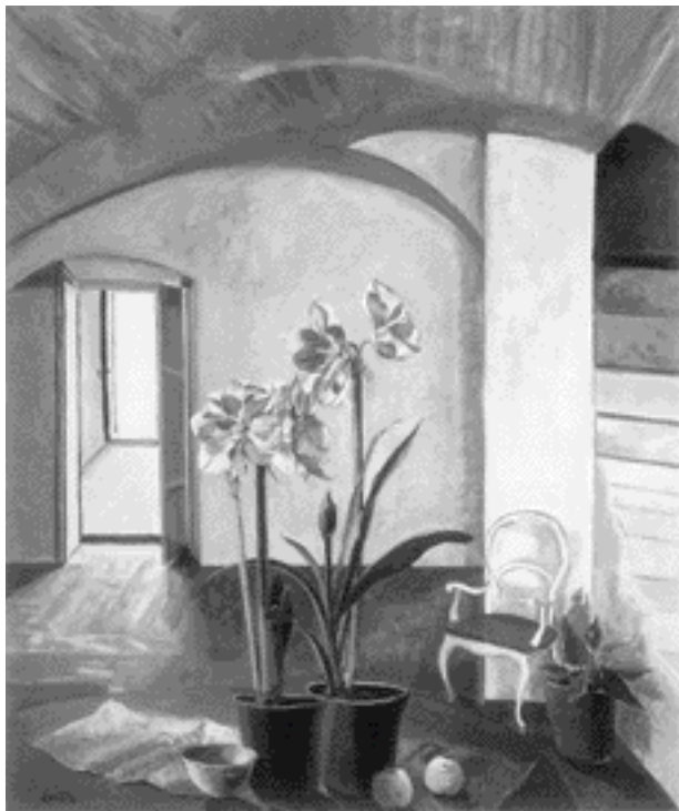
Vicente Gandía, Interior colonial , 2002