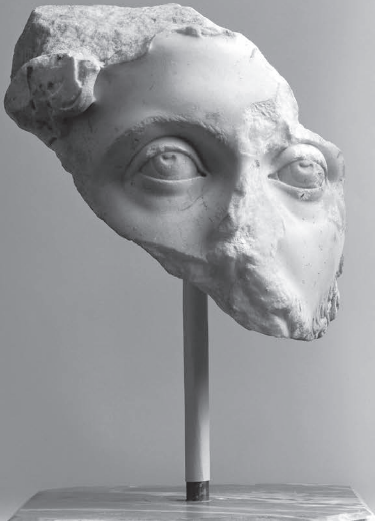
Retrato fragmentado de Marco Aurelio, ca. 180 d. C.