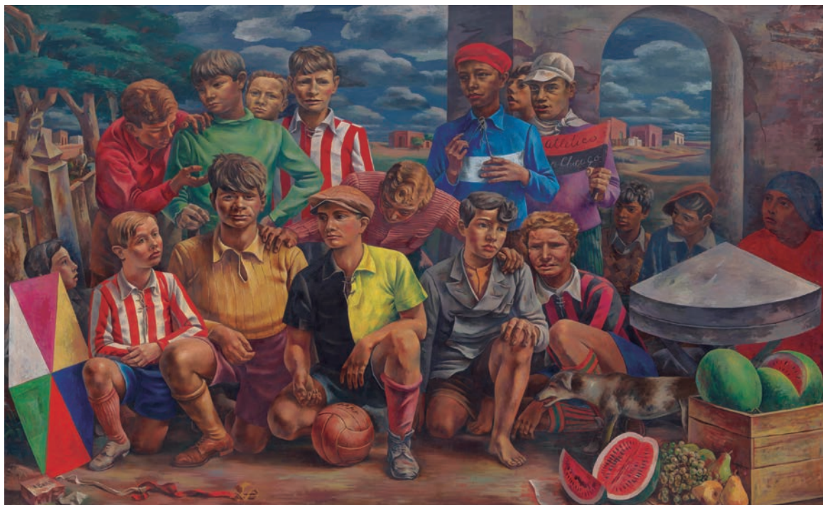
Antonio Berni, Club Atlético Nueva Chicago, 1937.

Los protagonistas de este óleo son una prueba de que el fútbol sudamericano, durante esa década, estaba bien asentado; “las cifras de asistencia a los estadios daban cuenta de su enorme popularidad [...], sus ligas se habían profesionalizado” 4 y los medios de comunicación empezaron a dedicar más tiempo a la cobertura de este deporte, construyendo una pasión en las infancias y juventudes que se constata en “Ayer vi ganar a los argentinos”, de Roberto Arlt. Esta crónica de 1929 expuso la identificación del pueblo argentino con el fútbol y, en particular, su apropiación por parte de los jóvenes pertenecientes a los sectores populares: “Los uruguayos dieron la impresión de desarrollar un juego más armónico que el de los argentinos, pero éstos, aunque desordenadamente, trabajaron con lo único que da el éxito en la vida: el entusiasmo”.