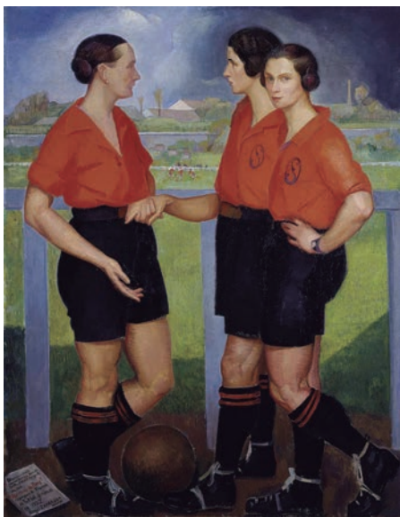
Ángel Zárraga, Las futbolistas , 1922. © SOMAAP, México, 2025.

Aunque la comparación entre Zárraga, Portinari y Berni sólo se puede hacer respecto a los temas y contextos de producción de sus obras, dejando de lado estilos y técnicas, se puede afirmar que el fútbol como “el deporte del pueblo” se concreta en dichas representaciones y que el protagonismo lo tienen la pobreza, el racismo, la falta de oportunidades