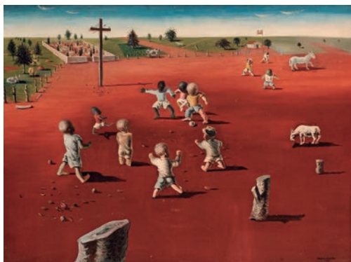
Cándido Portinari, Futbol , 1935. © SOMAAP, México, 2025.

La mayor parte de la población del barrio encontró en los mataderos su fuente laboral más importante; y en el fútbol, su distracción más significativa.