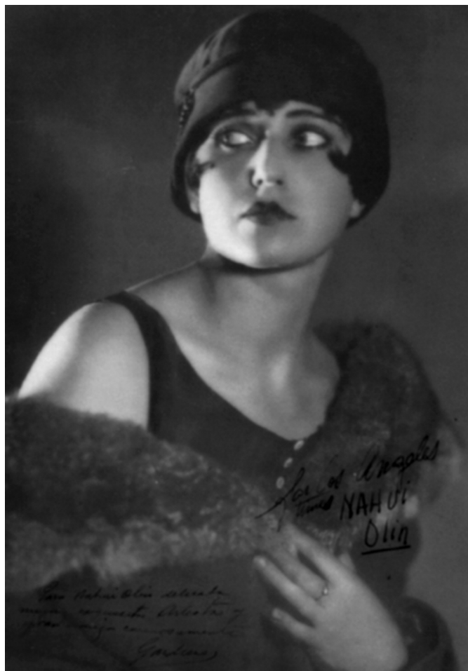
Nahui Olin en una fotografía