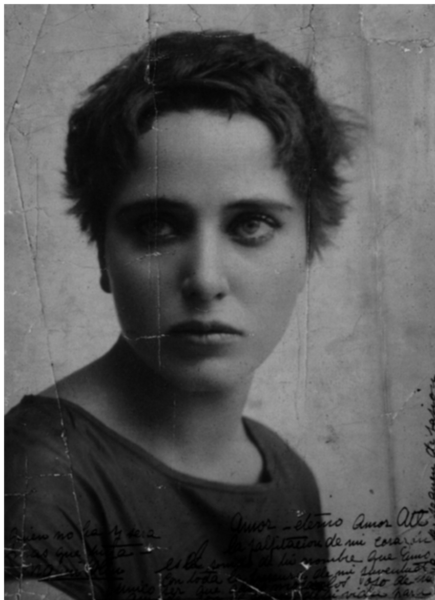
Anónimo, Nahui Olin con dedicatoria al Dr. Atl, s/f, colección Tomás Zurián Ugarte

En esta dirección se pueden ver obra y fotografías de Nahui: http://es.scribd.com/doc/75323853/Nahui-Olin-Una-Mujer-de-Los-Tiempos-Modernos-Completo