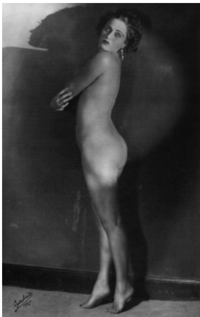
Nahui Olin en una fotografía de Antonio Garduño, s/f, colección Biblioteca de arte mexicano Ricardo Pérez Escamilla