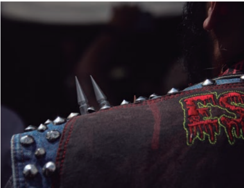
En las noches uniformes de la ciudad, la ropa se vuelve coraza, Ciudad de México, 2024.