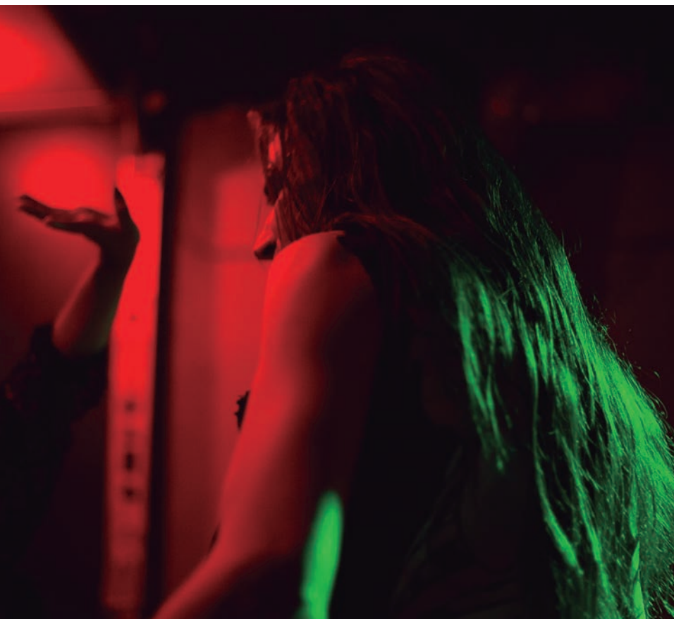
La colonia Guerrero late con un pulso gótico, Ciudad de México, 2024.

Grada Kilomba dice que la belleza, como el conocimiento, está atravesada por la colonialidad del ser y del saber. Y eso se notaba en qué autores se podían leer, qué música era válida y qué estéticas eran cools . Yo lo vi. Yo estuve ahí. Nadie me lo contó. Vi cómo trataban a los punks del Cerrito de la Cruz, a los metaleros de la Martínez Domínguez, a los góticos de Palomino Dena. A mi propio esposo que, por más música oscura que escuchara, nunca fue lo suficientemente gótico porque no estaba lo suficientemente desbarrializado, porque se