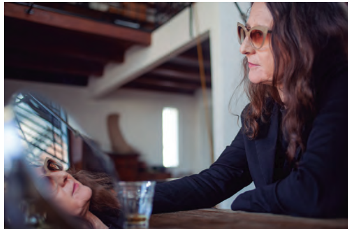
Lucrecia Martel, 2025.

mas categorías, y eso es completamente falso. Espera el que puede esperar.