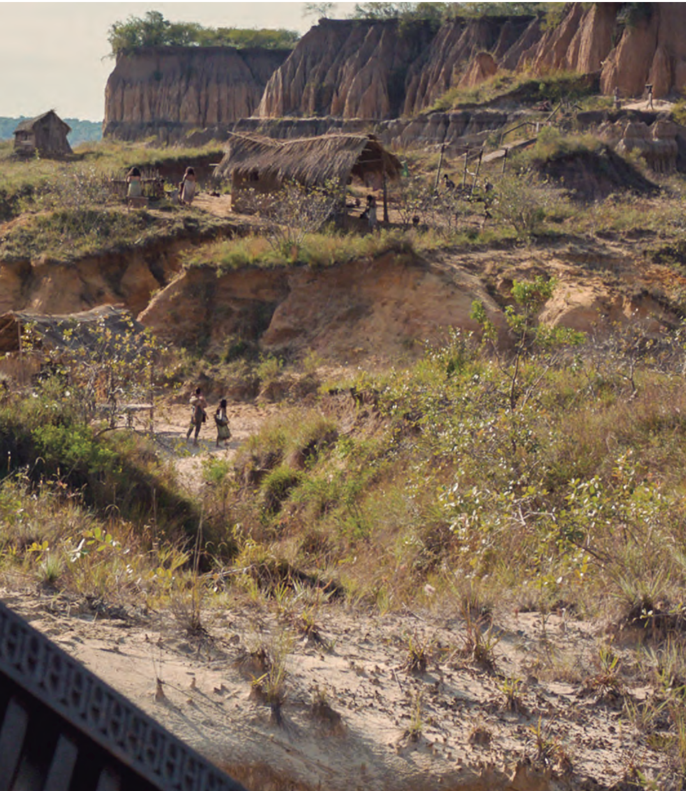
Fotograma de la película Zama , 2017.